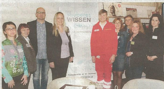
◆ Reinigungsprofis informierten sich beim Expertenfrühstück „Sauberes Wissen“

NÄHERE INFORMATIONEN auf www.saubereswissen.at